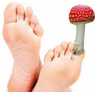
HYDRÁT CHYTRÁ houba je nemilosrdný zabiják nepříjemné plísně na nohách a pod nehty.