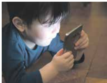
VÍTE, co právě sleduje vaše dítě na svém mobilu?

uspokojují u internetu od raného věku, mají problém navázat vztahy s dívkami. Fyzického kontaktu se bojí, normální vztah i sex je neuspokojí. Dokonce po partnerkách vyžadují to, co dělaly pornoherečky na internetu. Jsou také velmi neobratní v tzv. namlouvání, protože ve filmu se vždy šlo hned na věc. Ve skutečnosti většinou ne. Nechci přinášet nějaké apokalyptické vize, ale může se klidně stát, že nedostatek kvalitní sexuální výchovy v době internetu povede k postupnému snižování porodnosti. Chlapci přestanou ve skutečnosti opačné pohlaví