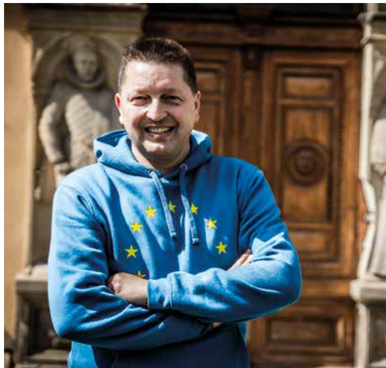
„U NÁS se bavím se sousedy o Evropské unii normálně v hospodě a naprostá většina z nich má jasno, že je to přínosný projekt,“ říká starosta Dolní Studénky.

Dolní Studénky na sebe upoutaly pozornost také renovací zámku