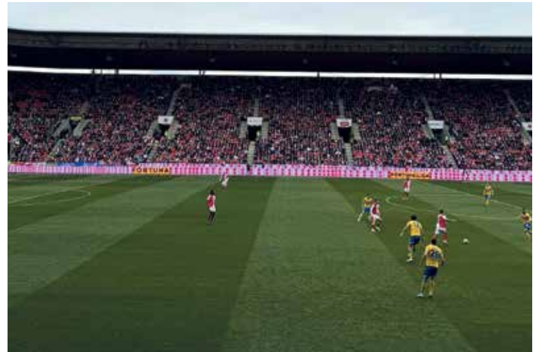
KDO chce v klidu sledovat fotbalový zápas, měl by do Edenu jezdit hromadnou dopravou.

„Naším fanouškům nabízíme řadu možností tak, aby se do Edenu dostali pohodlně, rychle a bezpečně i bez nutnosti využít auto. V posledním roce funguje skvěle spolupráce s Českými drahami i dopravním podnikem. Ze všech směrů je posílena kapacita, frekvence i dostupnost vlakového spojení na zastávku Nádraží Eden, kterou už dnes využívají každý