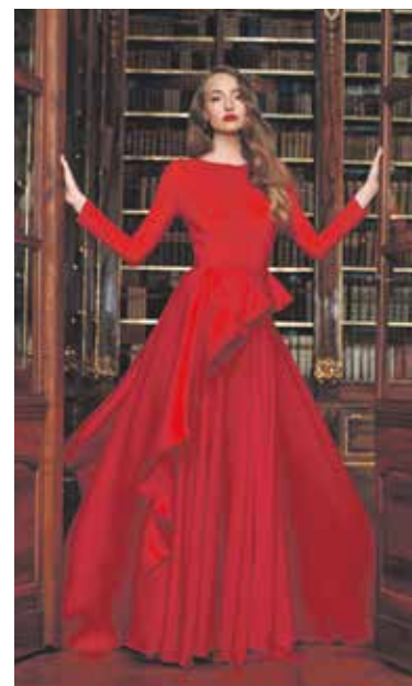
ZÁJEMCI získají šaty na míru a z kvalitního materiálu.

Když nepracujete, jak si nejlépe odpočínáte?