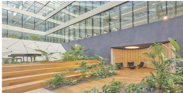
PROSKLENÉ atrium v nové administrativní budově.

Roztyly – Společnost Passerinvest Group otevřela zkolaudovanou administrativní budovu Roztyly Plaza. Ta se nachází přímo u stanice metra C Roztyly a zajímavou součástí sedmipodlažního objektu jsou umělecká díla – Světelný objekt ve dvoraně a pulsující vodní prvek v předpolí vstupu. V rámci lokality Nové Roztyly se počítá s navazující výstavbou, která by měla zahrnovat další administrativní a rezidenční etapy, kultivaci veřejného prostoru a rozvoj parkových ploch a zeleně. (red)