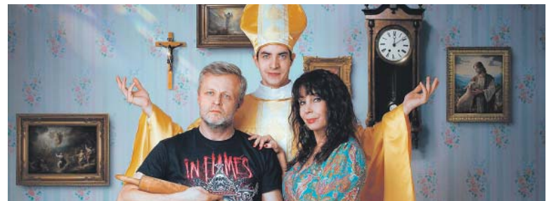
HELGA je herečka, kterou vyhodili z divadla. Pracuje proto v televizi jako věštkyně a pověde se jí ze záhrobní přivolat papeže Jana Pawla II. Ten změní chod jejího života...