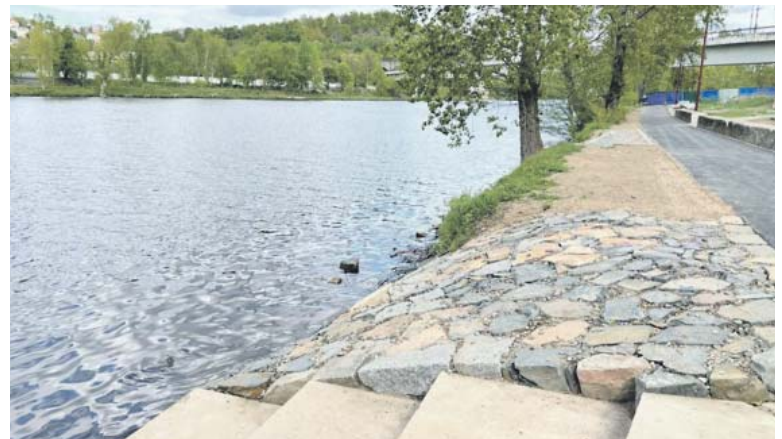
CELÝ PARK by se měl kompletně otevřít v průběhu letošního léta.

Holešovice - Práce na novém parku U Vody vstoupily do závěrečné fáze. Postup prací již umožnil zpřístupnit veřejnosti část parkových ploch, včetně průchodů a stezek pro pěší a cyklisty, které připravila TSK hl. m. Prahy. Nyní je možné se na kole či pěšky bez omezení dostat z dolních Holešovic od železničního mostu v ulici Varhulíkově podél řeky na cyklostezku mezi mostem Barikádníků a Trojským mostem a dále až do Stromovky a zpátky. V otevřených částech parku lze již také využít nového posezení, venkovní posilovny či vyhlídek a přístupů k řece. (red)