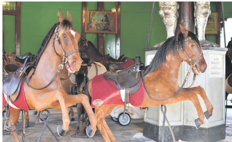
KOLOTOČ je unikátní atrakcí díky figurám koní, které jsou potažené pravou koňskou kůží.

Kolotoč tvoří původní novorenesanční dřevěný pavilon na půdorysu pravidelného dvanáctiúhelníku o rozpětí 12 metrů s trémovou konstrukcí s dřevěnými výplněmi a jehlanovou střechou, zakončenou lucernou dosahující výše 7,7 metru. Interiér Letenského kolotoče spolu s koňmi odkazuje na šlechtickou zábavu ze 17. a 18. století, tzv.