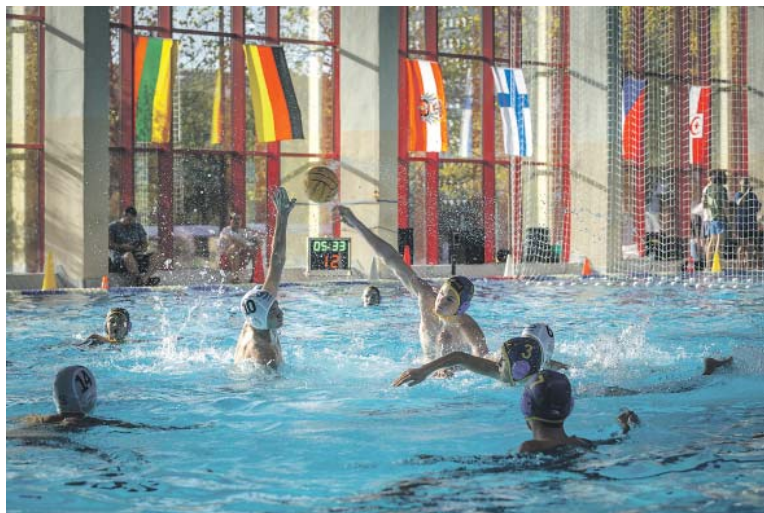
VODNÍ PÓLO můžou hrát ve Spartě kluci a holky již od osmi let.