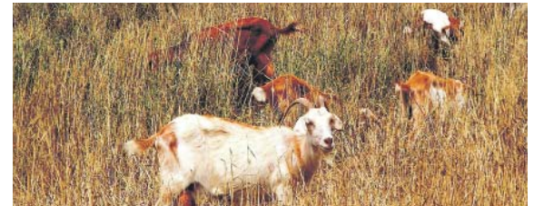
STÁDO KOZ se postará především o přerostlou vegetaci ve skálách a na strmých svazích.

Jedno stádo skotu bude celý rok v suchém poldru Čihadla mezi čtvrtěmi Kyje a Dolní Počernice. Druhé se bude přesouvat po vybraných