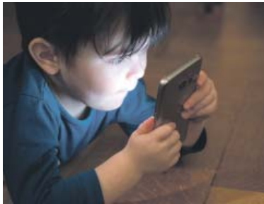
VÍTE, co právě sleduje vaše dítě na svém mobilu?

uspokojují u internetu od raného věku, mají problém navázat vztahy s dívkami. Fyzického kontaktu se bojí, normální vztah i sex je neuspokojí. Dokonce po partnerkách vyžadují to, co dělaly pornoherečky na internetu. Jsou také velmi neobratní v tzv. namlouvání, protože ve filmu se vždy šlo hned na věc. Ve skutečnosti většinou ne. Nechci přinášet nějaké apokalyptické vize, ale může se klidně stát, že nedostatek kvalitní sexuální výchovy v době internetu povede k postupnému snižování porodnosti. Chlapci přestanou ve skutečnosti opačné pohlaví