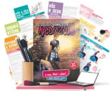
KVALITNÍ literatura by měla být pro děti prvním krokem při získávání poznatků ze světa sexu.

U otázky sexu v domácnosti s dítětem je důležité si najít pro sebe intimní prostor. Hlavní je předejít situaci, že by se dítě stalo pozorovatelem rodičů v těchto chvílích. (md)