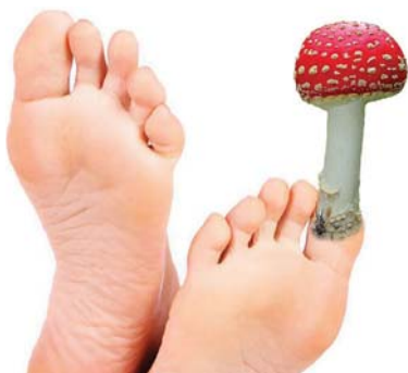
HYDRÁT CHYTRÁ houba je nemilosrdný zabiják nepříjemné plísni na nohách a pod nehty.

Mykózy nohou a nehtů nejčastěji vyvolávají dermatofyty Trichophyton, Microsporum nebo také ostatní houby, například Aspergily, či kvasinky. Infekcí se nakazíme z odpadlých šupinek kůže nebo drobné rohoviny zpod nehtů od nemocných lidí.