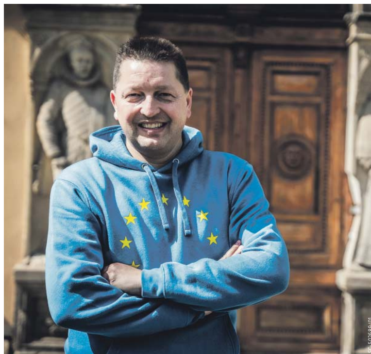
„U NÁS se bavím se sousedy o Evropské unii normálně v hospodě a naprostá většina z nich má jasno, že je to přínosný projekt,“ říká starosta Dolní Studénky.

Dolní Studénky na sebe upoutaly pozornost také renovací zámku