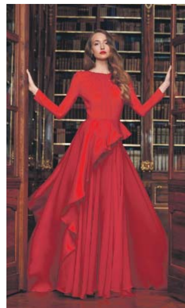
ZÁJEMCI získají šaty na míru a z kvalitního materiálu.

Když nepracujete, jak si nejlépe odpočínáte?