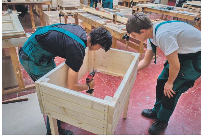
ŠIKOVNÍ kluci přeměnili strom v užitečné věci.

Jarov – Stejně jako v předchozích letech našel i loňský vánoční strom instalovaný na Staroměstském náměstí další využití. V dílně Střední odborné školy Jarov z něj studenti vyrábí venkovní prvky – tři zvýšené záhony na kolečkách, dva hmyzí hotely a jednu venkovní lavičku. „Letošními výrobky jsme se rozhodli potěšit obyvatele pražského domova pro osoby se zdravotním postižením Sulická. Zároveň se nám líbila i myšlenka, aby se strom symbolicky vrátil i na své ‚rodné‘ místo, kde více než půl století rostl. Jeden z vznikajících kousků, dřevěná lavička, proto poputuje k majiteli stromu z Pertoltic pod Ralskem. Stejně jako svoji odměnu za strom jí věnuje domovu seniorů v nedaleké Mimoně. Moc bych si přál, aby všechny výrobky,