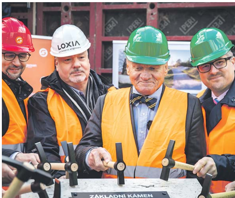
PRIMÁTOR hl. m. Prahy Bohuslav Svoboda (uprostřed) se zúčastnil poklepání základního kamene polyfunkční budovy.

Zásadním krokem v přípravě projektu bylo uzavření smlouvy o výstavbě a financování budovy mezi Prahou 14 a společností Dostupné bydlení České spořitelny (DBČS), které loni v prosinci schválili místní zastupitelé. Celkové předpokládané náklady na výstavbu polyfunkční budovy činí 630 milionů korun. DBČS do ní investovala 200 milionů korun, čímž se stala spoluvlastníkem budoucí bytové plochy objektu. Výše nájemného i samotné obsazování bytů nájemníky zůstane v celém domě v rukou zejména městské části.