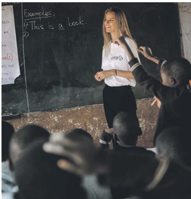
V TANZÁNII se snaží zajistit místním dětem lepší vzdělání.

Měla jste čas se porozhlédnout po Bombaji, aglomeraci, která má zhruba o tři miliony obyvatel více než celá naše republika?