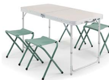
QUECHUA Skládací stůl pro 4–6 osob