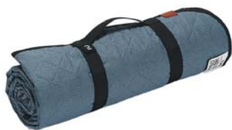
QUECHUA Kempingová deka 170 × 140 cm

Vybavte se na novou sezónu ještě výhodněji!