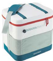
QUECHUA Kempingový chladicí box 25 l