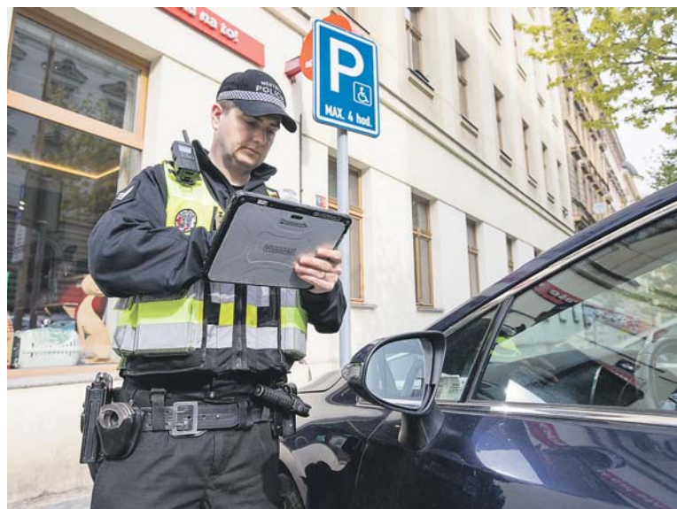
PRAŽSTÍ strážníci mají s neukázněnými řidiči stále plné ruce práce...

Na vyhrazeném parkovišti pro vozidlo označené parkovacím průkazem pro osoby se zdravotním postižením je vozidlům bez tohoto označení zakázáno zastavení a stání. Pokud řidič