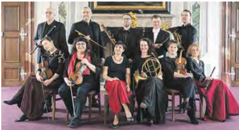
ORCHESTR Musica Florea hraje v co nejpůvodnějším hudebním aranžmá i ladění a používá dobové nástroje. Znamé skladby tak získávají nový zvuk a překvapí svou barvou nebo hravostí.