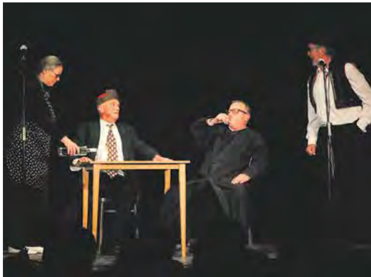
NA DOBEŠCE má pravidelný architektonický pořad a občas si tady zahraje s kolegy „sklepáky“.

Líbí se mi to stále, ale chápu také výhrady. Nicméně projekt ve mně vzbudil pozitivní emocionální energii. Víte, já si myslím, že největší vulgaritou u hlavního nádraží je průtah magistrály kolem Václavského náměstí. Ten tam nemá co dělat. A současná podoba stavby, která byla v interiéru velice kvalitní, což částečně zmizelo vestavbami trařik, odstraněním ikonických svítidel a dalšími úpravami, vlastně potvrzuje magistrálu. Navíc