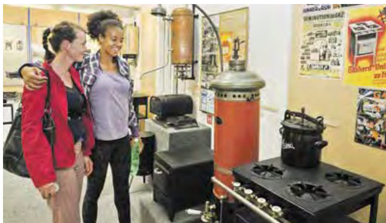
V PLYNÁRENSKÉM muzeu se na vlastní oči přesvědčíte, jak se dříve pomoci plynu nejen vařilo, ale i žehlilo či se upravovaly vlasy.

klad Městská knihovna, Národní zemědělské muzeum, Meet Factory, muzeum Davida Černého, Plynárenské muzeum, Kunsthalle, Galerie AMU, Atrium Žižkov, Platforma 15, Galerie Chodovská tvrz, Galerie Kurzor nebo Muzeum Karla Zemana. Program bude probíhat 15. června mezi 19.00 až 24.00 hodinou. Více informací na http://prazskamuzejninoc.cz . (red)