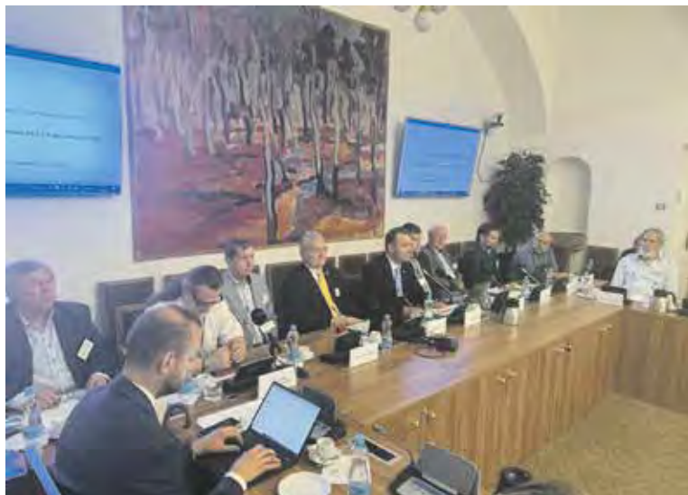
O SETKÁNÍ s odborníky a politiky byl velký zájem.