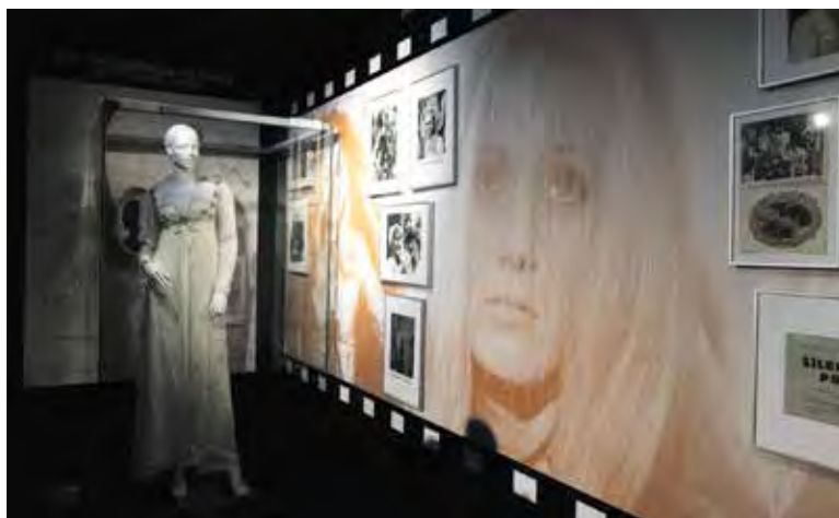
MEZI exponáty samozřejmě nechybí ani připomenutí filmu Šíleně smutná princezna.

prohlédnou přes sto originálních kostýmů, fotografie z osobního archivu, zlaté a diamantové desky za miliony prodaných nahrávek, ikonická hudební alba na LP, kazetách i CD nosičích, plakáty, trofeje Českého slavíka, raritní dárky od fanoušků, osobní věci i vzácné vzpomínky. Výstava je přístupná do 23. února 2025. (red)