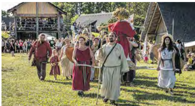
PROJĎTE branou oppida a poznejte svět obyvatel starověké Evropy. Seznamte se s Keltů, Germány a Římany ze všech koutů Evropy a objevte jejich obydlí, starodávná řemesla i zbraně.

vše můžete zažít během dvoudenní akce 26. a 27. července. Téma nové trilogie festivalu nese název Čas králů a královen a bude vás provázet celým festivalem. Přenesete se do různých