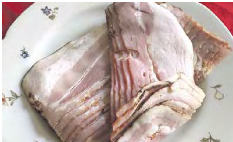
ANGLICKÁ slanina se hodí při vaření nebo si ji lze dát jen tak s pečivem.