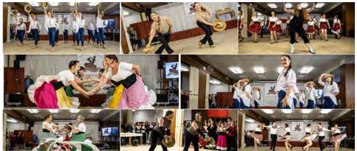
V TK CALIPSO rádi mezi sebou přivítají nové členy z řad dětí, dopívající mládeže, ale i dospělých.

Taneční klub má v červnu 30 let, a proto zve na oslavu všechny milovníky country. Akce proběhne 15. června od 18.30 hod. v divadle U22 v Sokolovně 201/8, Praha 22, Uhřetíněves. (red)