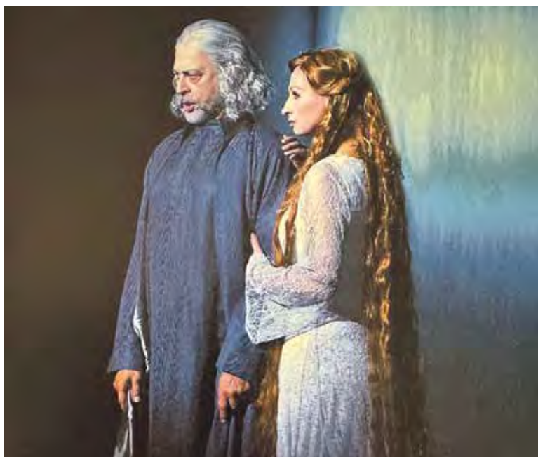
K JEHO nejoblíbenějším rolím patřil Vodník.

SOUČASNOST. V pátek 14. června slavím narozeniny a mám jen jedno přání – abych byl pokud možno zdravý já i celá moje rodina. Radost mi dělá vnučka, kterou učím hrát na piano. Neustále mi přitom jde muzika v hlavě, to je určitá profesní deformace. Měl ji i můj otec, který ve 30. letech vedl vlastní orchestr. Někdy je to až obtěžující a musím si vyčistit hlavu třeba delší procházkou po Strašnicích.