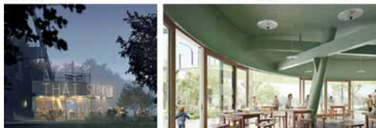
VÍTĚZNÝ návrh nové zahradní restaurace s vyhlídkovou věží. Zdroj: Atelier Amont / Logan Michael Allen