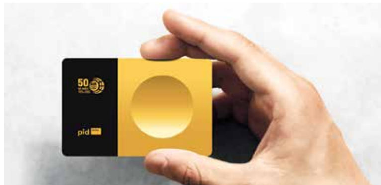
DESIGN limitované edice karty Lítačka je inspirován unikátními obklady stěn, které navrhl hlavní architekt pražského metra Jaroslav Otruba. Dlaždice zvané lidově „prsa“ a „antiprsa“ jsou charakteristické pro linku A.

Příští rok oslaví DPP další dvě významná výročí týkající se MHD v Praze - 150 let od zahájení provozu MHD jako takové a 100 let od zahájení provozu pravidelné autobusové dopravy. Je proto možné, že DPP připraví další limitované edice karet Lítačka. (red)