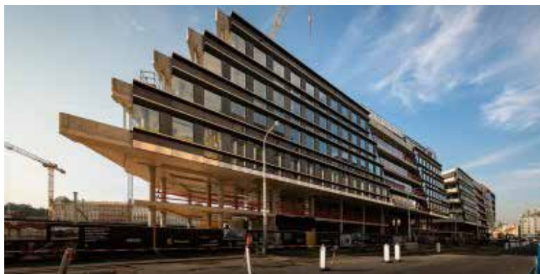
MASARYKOVO nádraží se razantně promění.

Praha – Po dobu letních prázdnin, tedy od 1. 7. do 31. 8., proběhnou stavební práce na obnově železniční trati v karlínské oblasti Sluncová (Pod Krejčárkem). Na Masarykově nádraží začne demontáž zastřešení na nástupišti mezi 6. a 7. kolejí. Linky S2 a S22 (Praha – Lysá nad Labem – Kolín/Milovice) tak nebudou zajíždět na Masarykovo nádraží, ale budou odkloněny na hlavní nádraží. Linka S34 (Praha Masarykovo nádraží – Praha-Čakovice) bude ukončena ve Vysočanech. Cílem