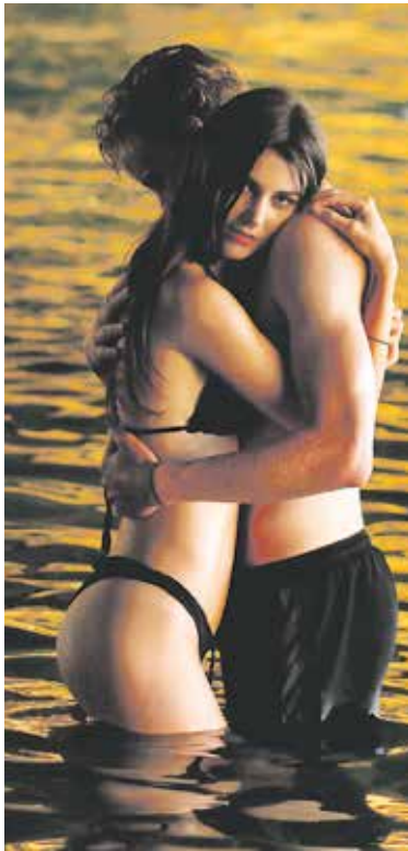
PRÁVĚ se dozvěděli, že jim podvodníci vysáli účet...

působily velmi věrohodně a jejich grafická úprava napodobovala stránky MPSV, České správy sociálního zabezpečení nebo Identity občana a dalších institucí.