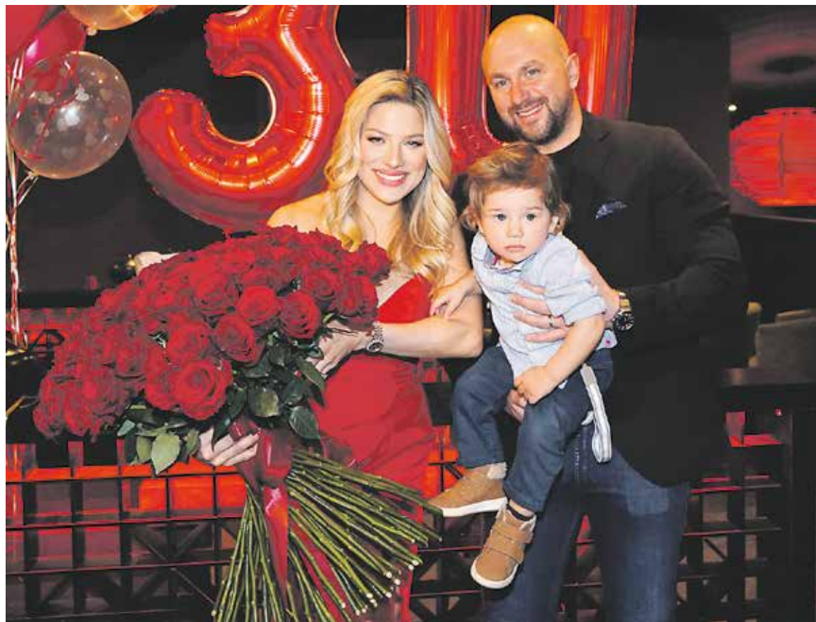
NA OSLAVĚ svých 30. narozenin s manželem a synem Kilianem.

Asi si nevybavím nic, u čeho jsem měla nutkání říct si – toto já nikdy dělat nebudu. Mys-