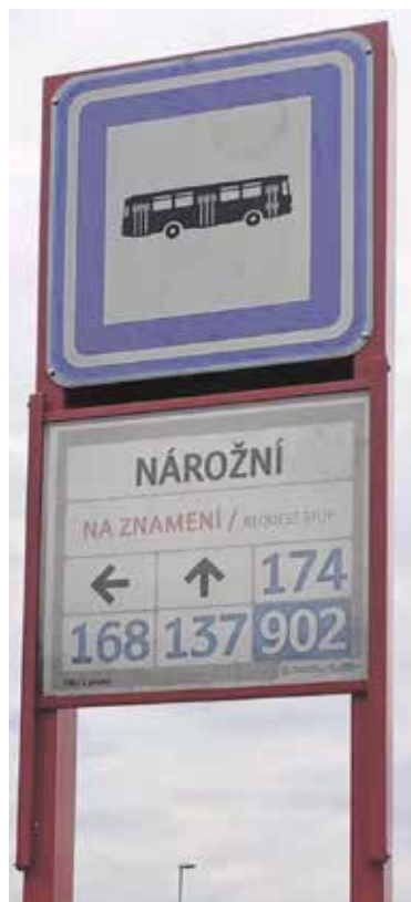
VŠECHNY autobusové zastávky jsou nově na znamení.

Zejména večer a o víkendech se v některých případech mohou dokonce snížit intervaly mezi spoji při stejném počtu řidičů a vozidel. (red, PID)