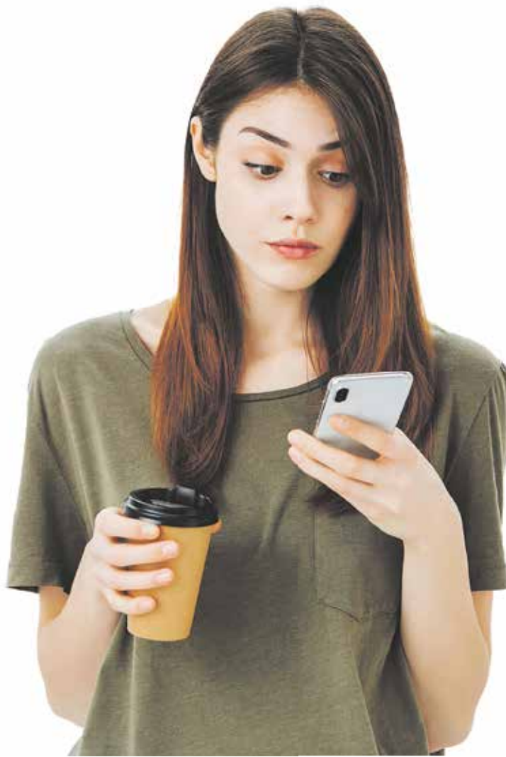
INTERNETOVÉ BANKOVNICTVÍ v mobilu může při nepromyšlených manipulacích přinést potíže.

Podivné e-shopy, které lákají na nízké ceny a pak zaplacené zboží nedodají nebo zneužijí platební údaje, jsou poněkud na ústupu, ale stále na ně můžete narazit. Proto je důležité být při nakupování na internetu ostražitý a vyhledávat recenze a zkušenosti ostatních zákazníků s daným e-shopem. Navíc je dobré si ověřit, zda internetový obchod splňuje všechny zákonné požadavky a jestli disponuje platnými kontaktními údaji, jako jsou adresa, telefonní číslo a e-mail. Při placení za zboží se doporučuje využívat bezpečných platebních metod, jako jsou například platební brány nebo platby přes PayPal. Dále je vhodné se vyvarovat nákupů na neznámých webových stránkách, které nemají dostatečně profesionální vzhled nebo obsahují mnoho gramatických chyb. V případě, že jste již obětí podvodného e-shopu, je důležité okamžitě kontaktovat svou banku a nahlásit možné zneužití platebních údajů. Dále je vhodné informovat o svých zkušenostech ostatní zákazníky prostřednictvím recenzí na internetu a podat stížnost na příslušné orgány, jako je například Česká obchodní inspekce. „Příkladem situace, kdy se stává kupující obětí podvodu, může být na první pohled lákavá nabídka výrazně levného zboží, kdy posíláte