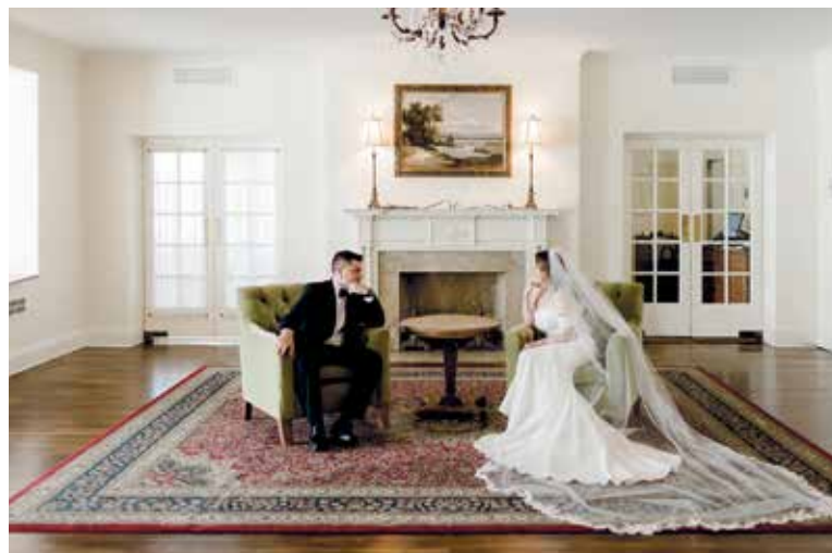
MÁLOKTERÝ mladý manželský pár může o sobě říci, že se hned po svatbě stěhuje do svého...

„V předchozích třinácti letech se obecní bytový fond snížil o více než polovinu. Tento trend se ale