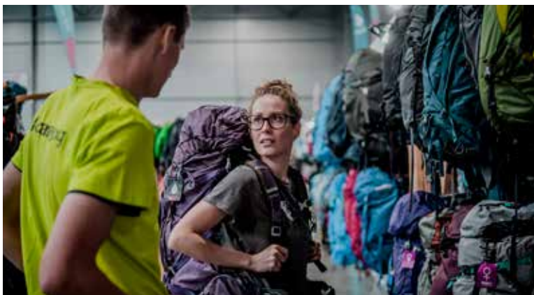
VÝSTAVOU zájemce provede proškolený personál a outdooroví nadšenci, kteří zákazníkům pomohou porovnat a vybrat vybavení na hory, túry, vodu nebo procházky po městě či po lese.

zejí pořadatelé nově i s výběrem oblečení a širokou nabídkou obuvi nejen do přírody. To vše budou po celé léto doprovázet akce a soutěže s hodnotnými cenami. Výstava stanů je přístupná denně od 10.00 do 20.00 hodin a kromě nákupu na místě tu můžete využít výdejní místo e-shopu 4camping.cz . Vstup i parkování je zdarma. (red)