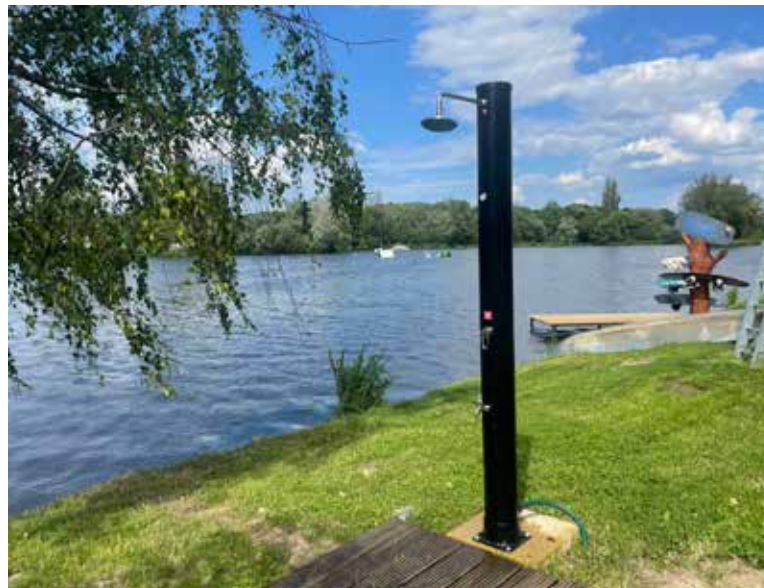
KVALITA vody v nádrži se pravidelně sleduje a vyhodnocuje.

Odpočinkovou plochu letos pro městskou část spravuje společnost Wake Park, která provozuje i sousední Wake Park Džbán s vodními vleky. U provozovatele si bude možné zapůjčit lehátka a houpací síť nebo hamaky pro odpočinek, paddleboardy a další zábavné i sportovní aktivity pro děti i dospělé. Tyto služby jsou k dispozici ve všední dny od 12.00 do 20.00 hodin, o víkendů se odpočinková plocha otevírá už v 10.00 hodin. Toalety jsou vyhrazeny pouze pro rekreaty, tedy budou udržované a čisté.