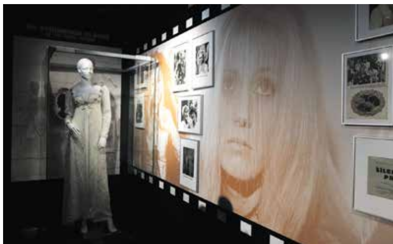
MEZI exponáty samozřejmě nechybí ani připomenutí filmu Šíleně smutná princezna.

prohlédnou přes sto originálních kostýmů, fotografie z osobního archivu, zlaté a diamantové desky za miliony prodaných nahrávek, ikonická hudební alba na LP, kazetách i CD nosičích, plakáty, trofeje Českého slávika, raritní dárky od fanoušků, osobní věci i vzácné vzpomínky. Výstava je přístupná do 23. února 2025. (red)