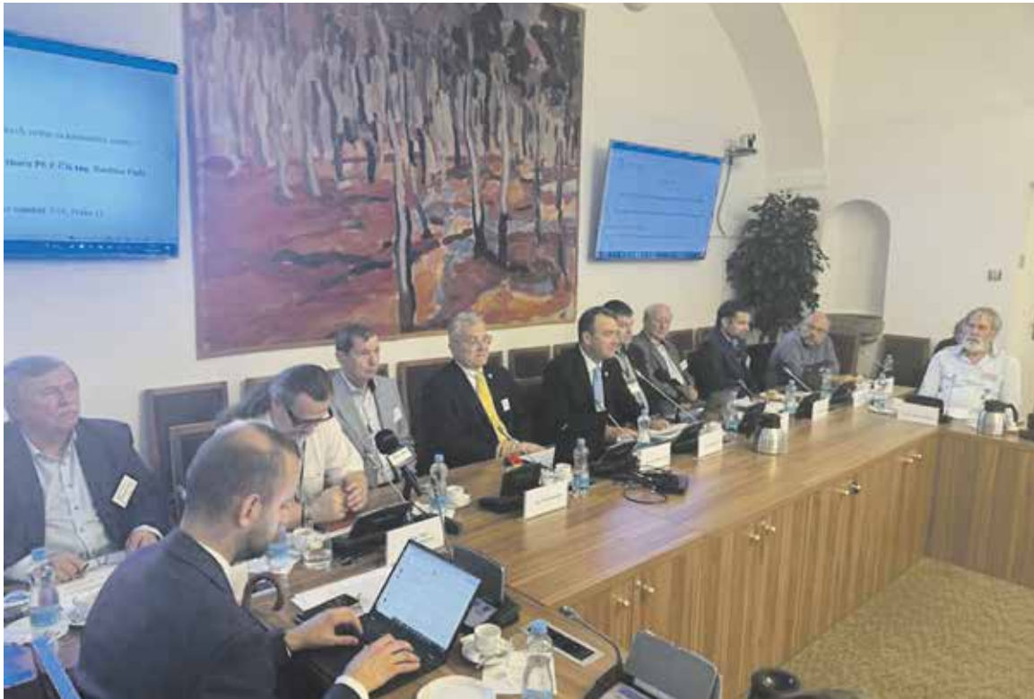
O SETKÁNÍ s odborníky a politiky byl velký zájem.

vědeckých časopisech se dá publikovat za poplatek. Jsou to tzv. predátorské časopisy a může publikovat kdokoli v e-mailu, aniž by to sneslo jakoukoliv vědeckou kritiku. Sám ukázal nabídky, které denně dostává. Za necelou hodinu mu v e-mailu přistálo sedm nabídek na publikaci v různých vědeckých časopisech za úplat. „Na vědce je vyvíjen tlak, aby publikovali pouze to, co se od nich očekává,“ vysvětlil Bocák. „Když člověk publikuje něco, co nechce, tak to do tiskové zprávy nejde. Vědec musí zpívat písničku, kterou po něm chtějí. Když je třeba mladý vědec a postaví se na zadní, tak má zcela jistotu, že do důchodu nepůjde jako akademik,“ vysvětlil současnou situaci ve vědě.