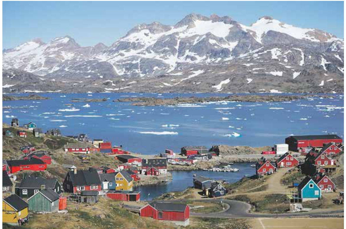
MOŽNÁ se už naše vnoučata dozijí toho, že se Grónsko opět zazelená.

Ladislav Bocák poukázal také na fakt, že statistiky jsou záměrně manipulovány tím, že