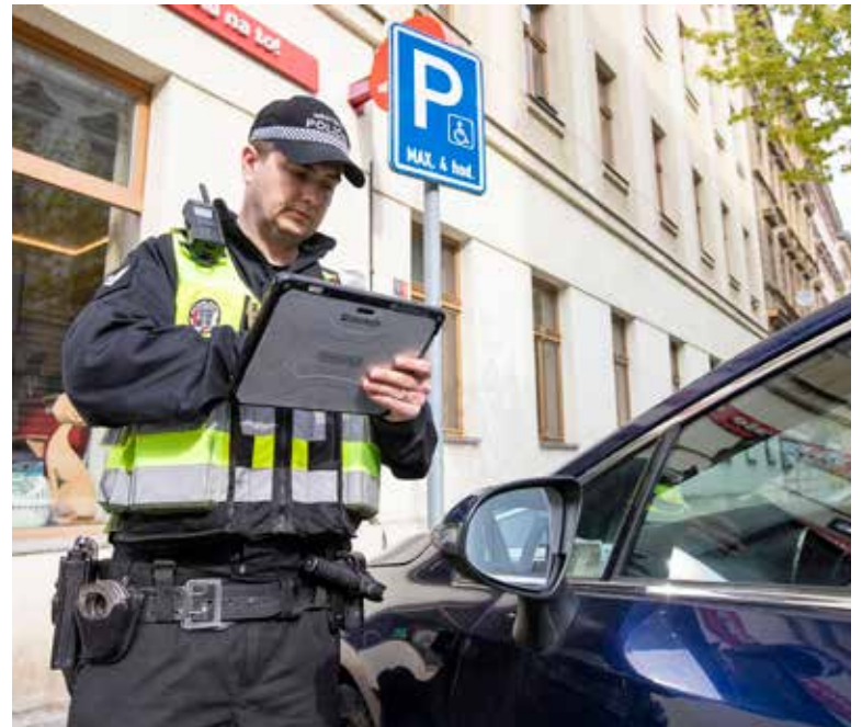
POKUD jsou splněny legislativní podmínky, může strážník nařídit i odtah vozidla.

Na vyhrazeném parkovišti pro vozidlo označené parkovacím průkazem pro osoby se zdravotním postižením je vozidlem bez tohoto označení zakázáno zastavení a stání. Pokud řidič zastaví (tzn. uvede vozidlo do klidu na dobu nezbytně nutnou k neprodlenému nastoupení nebo vystoupení přepravovaných osob anebo k neprodlenému naložení nebo složení nákladu) na řádně označeném parkovišti pro invalidy, hrozí mu na místě pokuta do výše