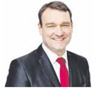
SEMINÁŘ se uskutečnil pod záštitou Radima Fialy (SPD), místopředsedy Hospodářského výboru Poslanecké sněmovny ČR.

V regulacích jsou i takové detaily, že se v budovách nebude smět větrat okny. „Tedy se vymýšlí, jak zajistit zpětné větrání bez otevřených oken. Je to úplně zbytečná komplikace, která bude stát lidi opět velké peníze,“ vysvětlil Urban. Další komplikací je podle něj schválené prokazování „bezuh-