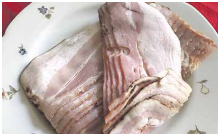
ANGLICKÁ slanina se hodí při vaření nebo si ji lze dát jen tak s pečivem.

I v měření soli se mimo úředně tolerovanou odchylku ocitlo několik výrobků. Výrobek Lidl/Pikok Pure byl výrazně slanější, než by zákazník dle obalu čekal. Obsah soli byl podle laboratoře 2,93 g/100 g, ačkoliv obal uváděl 2,2 g/100 g. Mimo toleranci se ocitly i slaniny značek Naše maso a Ponnath. V jejich případech bylo naopak soli méně, což také není v pořádku, ale ze zdravotního hlediska to není problém. Zdroj: dTest