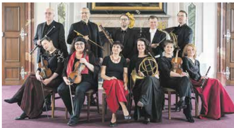
ORCHESTR Musica Florea hraje v co nejpůvodnějším hudebním aranžmá i ladění a používá dobové nástroje. Znamé skladby tak získávají nový zvuk a překvapí svou barvou nebo hravostí.