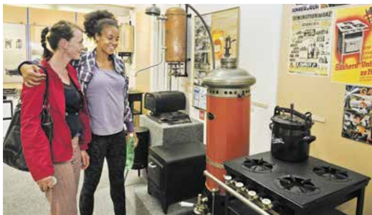
V PLYNÁRENSKÉM muzeu se na vlastní oči přesvědčíte, jak se dříve pomoci plynu nejen vařilo, ale i žehlilo či se upravovaly vlasy.

klad Městská knihovna, Národní zemědělské muzeum, Meet Factory, muzeum Davida Černého, Plynárenské muzeum, Kunsthalle, Galerie AMU, Atrium Žižkov, Platforma 15, Galerie Chodovská tvrz, Galerie Kurzor nebo Muzeum Karla Zemana. Program bude probíhat 15. června mezi 19.00 až 24.00 hodinou. Více informací na http://prazskamuzejninoc.cz . (red)