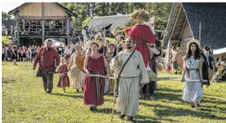
PROJĎĚTE branou oppida a poznejte svět obyvatel starověké Evropy. Seznamte se s Keltů, Germány a Římany ze všech koutů Evropy a objevte jejich obydlí, starodávná řemesla i zbraně.

vše můžete zažít během dvou-denní akce 26. a 27. července. Téma nové trilogie festivalu nese název Čas králů a královen a bude vás provázet celým festivalem. Přenesete se do různých