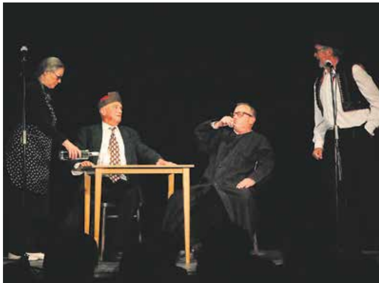
NA DOBEŠCE má pravidelný architektonický pořad a občas si tady zahraje s kolegy „sklepáky“.

Líbí se mi to stále, ale chápu také výhrady. Nicméně projekt ve mně vzbudil pozitivní emocionální energii. Víte, já si myslím, že největší vulgaritou u hlavního nádraží je průtah magistrály kolem Václavského náměstí. Ten tam nemá co dělat. A současná podoba stavby, která byla v interiéru velice kvalitní, což částečně zmizelo vestavbami trařik, odstraněním ikonických svítidel a dalšími úpravami, vlastně potvrzuje magistrálu. Navíc