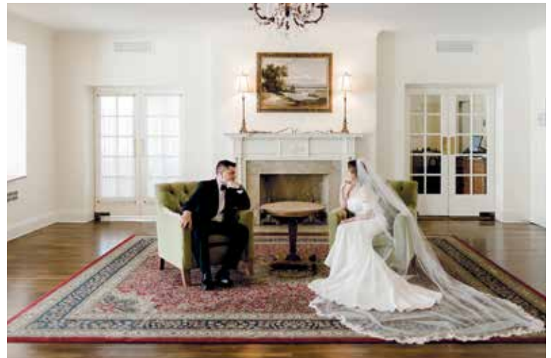
MÁLOKTERÝ mladý manželský pár může o sobě říci, že se hned po svatbě stěhuje do svého...

„V předchozích třinácti letech se obecní bytový fond snížil o více než polovinu. Tento trend se ale