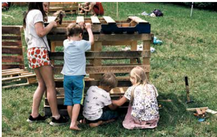
DĚTI si vlastnoručně postaví to, v čem si chtějí hrát.

Naš spolek s MČ Praha 6 již dlouhodobě spolupracuje na různých projektech zaměřených na veřejný prostor a nabídku pro