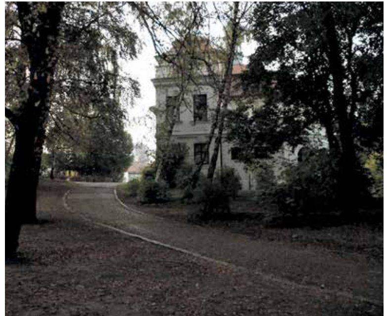
V ZÁMECKÉM areálu najdete zajímavá zákoutí.

„Městská část tak dohodou se státem získala i možnost hledat pro veveslavínský zámek novou budoucnost. Nicméně nemůžeme zapomínat na fakt, že ministerstvo financí avizovalo na letošní rok prodej areálu formou aukce,“ říká statutární místostarosta městské části Praha 6 Petr Prokop (STAN). (red, Praha 6)