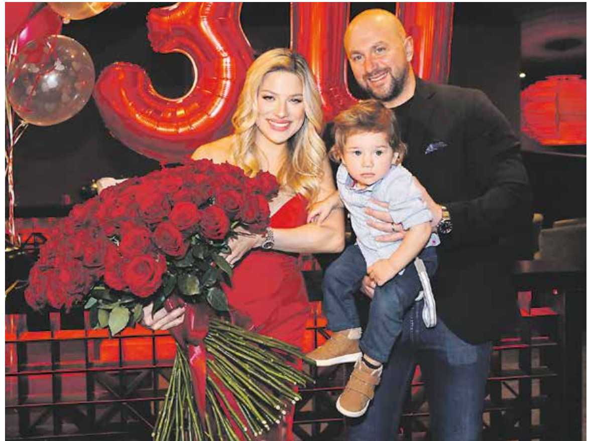
NA OSLAVĚ svých 30. narozenin s manželem a synem Kilianem.

Asi si nevybavím nic, u čeho jsem měla nutkání říct si – toto já nikdy dělat nebudu. Mys-