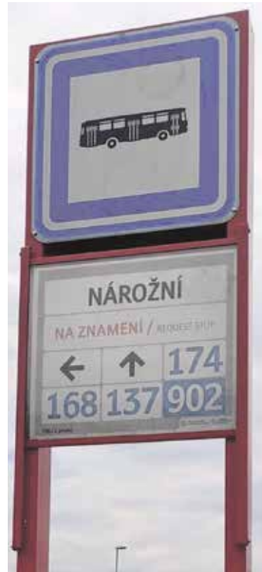
VŠECHNY autobusové zastávky jsou nově na znamení.

Zejména večer a o víkendech se v některých případech mohou dokonce snížit intervaly mezi spoji při stejném počtu řidičů a vozidel. (red, PID)