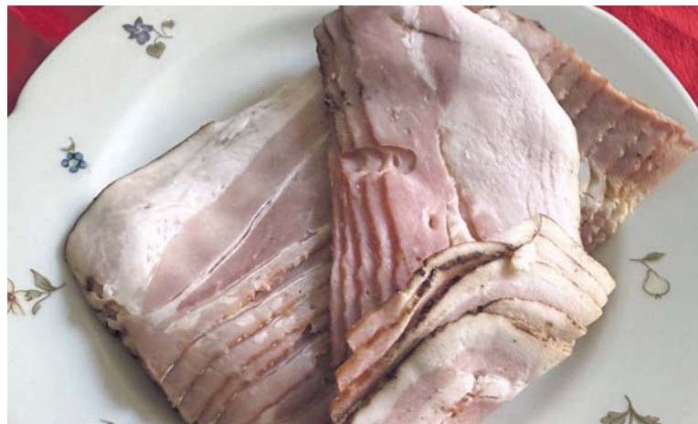
ANGLICKÁ slanina se hodí při vaření nebo si ji lze dát jen tak s pečivem.

I v měření soli se mimo úředně tolerovanou odchylku ocitlo několik výrobků. Výrobek Lidl/Pikok Pure byl výrazně slanější, než by zákazník dle obalu čekal. Obsah soli byl podle laboratoře 2,93 g/100 g, ačkoliv obal uváděl 2,2 g/100 g. Mimo toleranci se ocitly i slaniny značek Naše maso a Ponnath. V jejich případech bylo naopak soli méně, což také není v pořádku, ale ze zdravotního hlediska to není problém. Zdroj: dTest