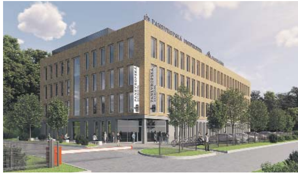
AUTOREM architektonického objektu je Ing. arch. Aleš David.

Vysočany – V areálu Českých vinařských závodů proběhl slavnostní ceremoniál poklepání základního kamene víceúčelového a vzdělávacího zařízení. Hlavním nájemníkem tohoto zařízení bude Panevropská univerzita (PEUNI). S ohledem na předpokládané náklady ve výši přibližně 400 milionů Kč