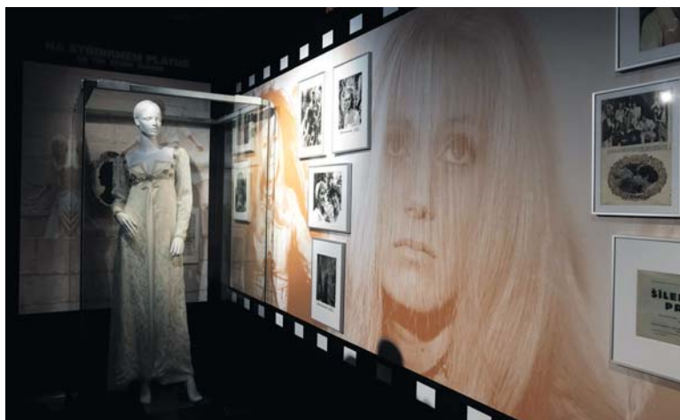
MEZI exponáty samozřejmě nechybí ani připomenutí filmu Šíleně smutná princezna.

prohlédnou přes sto originálních kostýmů, fotografie z osobního archivu, zlaté a diamantové desky za miliony prodaných nahrávek, ikonická hudební alba na LP, kazetách i CD nosičích, plakáty, trofeje Českého slávika, raritní dárky od fanoušků, osobní věci i vzácné vzpomínky. Výstava je přístupná do 23. února 2025. (red)