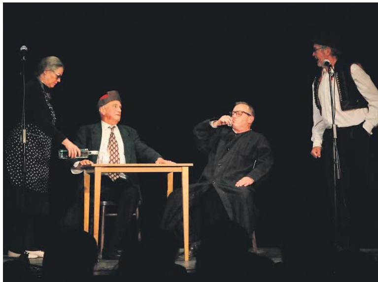
NA DOBEŠCE má pravidelný architektonický pořad a občas si tady zahraje s kolegy „sklepáky“.

Když už jsme u architektury, velkou diskuzi vzbudili nedávno motýli na obchodním domě Máj. Ale co říkáte třeba plánované nové podobě hlavního nádraží? Líbí se mi to stále, ale chápu také výhrady. Nicméně projekt ve mně vzbudil pozitivní emocionální energii. Víte, já si myslím, že největší vulgaritou u hlavního nádraží je průtah magistrály kolem Václavského náměstí. Ten tam nemá co dělat. A současná podoba stavby, která byla v interiéru velice kvalitní, což částečně zmizelo vestavbami trařik, odstraněním ikonických svítidel a dalšími úpravami, vlastně potvrzuje magistrálu. Navíc