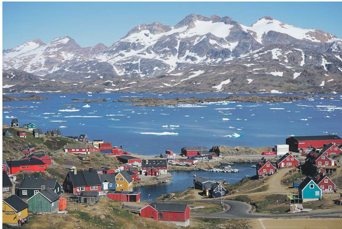
MOŽNÁ se už naše vnoučata dožijí toho, že se Grónsko opět zazelená.

Ladislav Bocák poukázal také na fakt, že statistiky jsou záměrně manipulovány tím, že