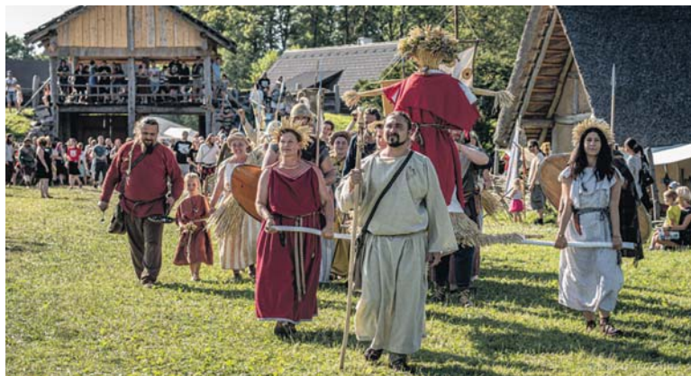
PROJDETE branou oppida a poznejte svět obyvatel starověké Evropy. Seznamte se s Kelti, Germány a Římany ze všech koutů Evropy a objevte jejich obydlí, starodávná řemesla i zbraně.

Téma nové trilogie festivalu nese název Čas králů a královen a bude vás provázet celým festivalem. Přenesete se do různých