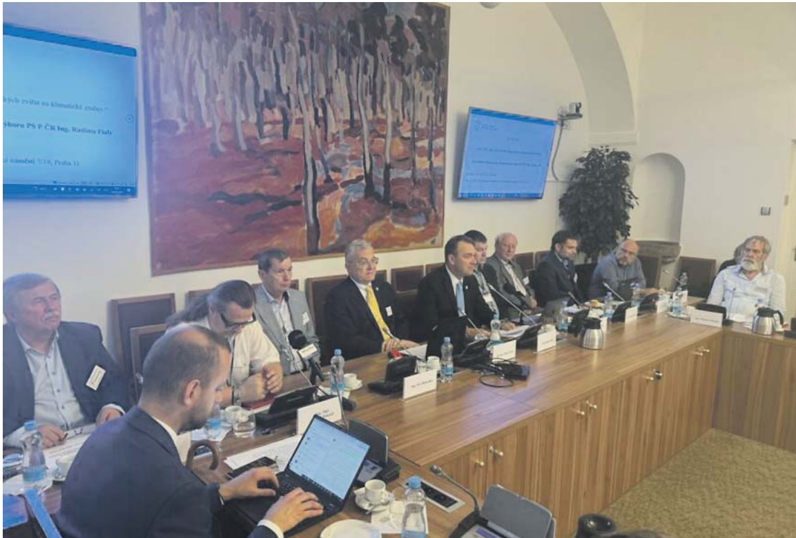
O SETKÁNÍ s odborníky a politiky byl velký zájem.

vědeckých časopisech se dá publikovat za poplatek. Jsou to tzv. predátorské časopisy a může publikovat kdokoli v čemkoliv, aniž by to sneslo jakoukoliv vědeckou kritiku. Sám ukázal nabídky, které denně dostává. Za celou hodinu mu v e-mailu přistálo sedm nabídek na publikaci v různých vědeckých časopisech za úplat. „Na vědce je vyvíjen tlak, aby publikovali pouze to, co se od nich očekává,“ vysvětlil Bocák. „Když člověk publikuje něco, co nechce, tak to do tiskové zprávy nejde. Vědec musí zpívat písničku, kterou po něm chtějí. Když je třeba mladý vědec a postaví se na zadní, tak má zcela jistotu, že do důchodu nepůjde jako akademik,“ vysvětlil současnou situaci ve vědě.