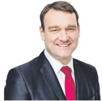
SEMINÁŘ se uskutečnil pod záštitou Radima Fialy (SPD), místopředsedy Hospodářského výboru Poslanecké sněmovny ČR.

V regulacích jsou i takové detaily, že se v budovách nebude smět větrat okny. „Tedy se vymýšlí, jak zajistit zpětné větrání bez otevřených oken. Je to úplně zbytečná komplikace, která bude stát lidi opět velké peníze,“ vysvětlil Urban. Další komplikací je podle něj schválené prokazování „bezuh-