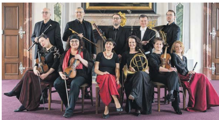
ORCHESTR Musica Florea hraje v co nejpůvodnějším hudebním aranžmá i ladění a používá dobové nástroje. Znamé skladby tak získávají nový zvuk a překvapí svou barvou nebo hravostí.