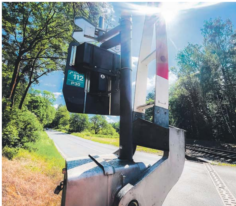
DO KONCE roku Správa železnic plánuje obnovu polepu na všech železničních přejezdech, vyrobit by se mělo na 22 tisíc reflexních štítků.

Identifikační štítky se vylepují na zadní stranu signalizačních světel nebo výstražných křížů. Použijí se nové polepy, které jsou lépe viditelné díky reflexnímu povrchu, tedy i během nočních hodin. Značení slouží mimo jiné k rychlé identifikaci místa například v případech, kdy na přejezdu uvízne auto a řidič potřebuje nahlásit místo události na tísňovou linku. Právě proto číselné označení přejezdu doplní ještě zelená samolepka s piktoqramem telefonu a číslem linky 112 (SOS 112). (red)