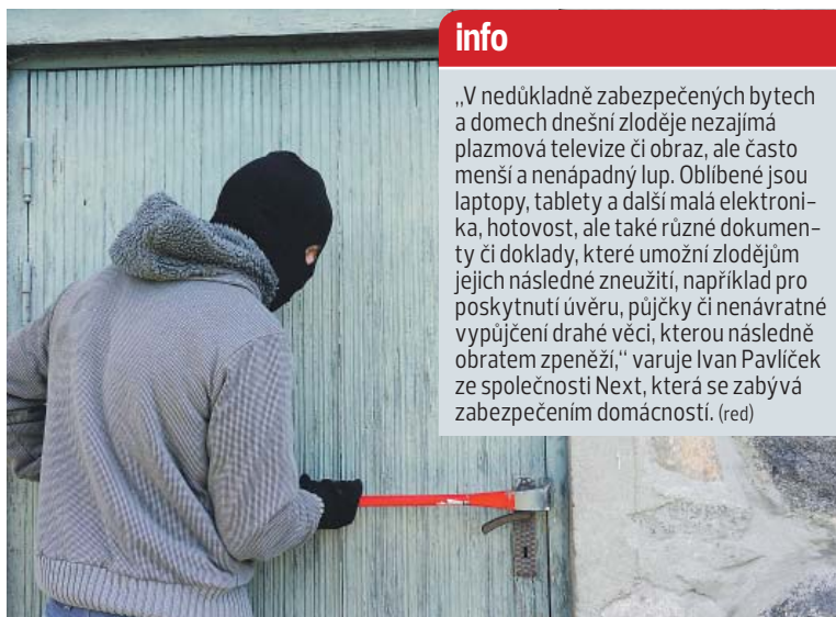
DOBŘE uzamčený sklep, garáž či dílna vás mají ochránit před nevitány návštěvníky.