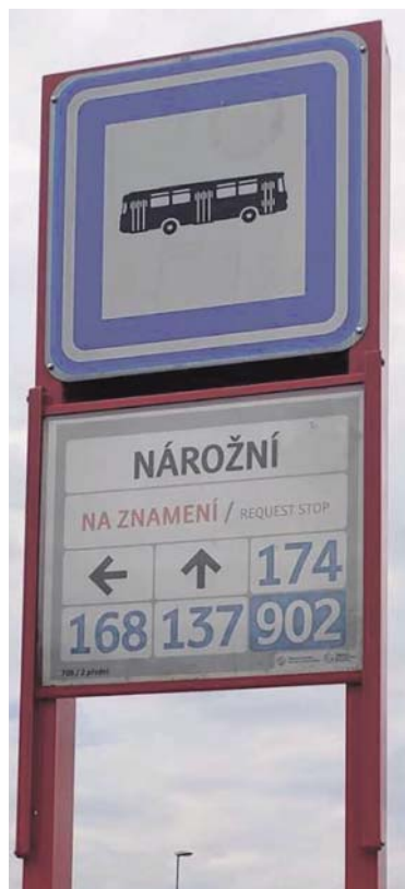
VŠECHNY autobusové zastávky jsou nově na znamení.

Zejména večer a o víkendech se v některých případech mohou dokonce snížit intervaly mezi spoji při stejném počtu řidičů a vozidel. (red, PID)