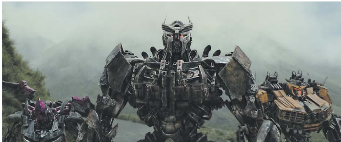
DIVÁCI se mohou těšit na nejnovější díl série o Transformers.

■ Čtvrteční večery na začátku prázdnin a čtyři čtvrteční večery na jejich konci budou letos v Centru Černý Most opět patřit filmům. Na travnaté ploše u hlavního vstupu totiž najdete Paramount MAX kino.