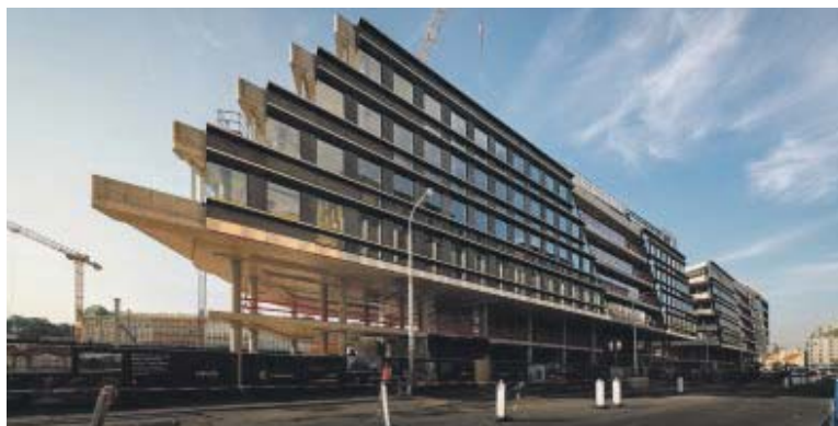
MASARYKOVO nádraží se razantně promění.

Praha – Po dobu letních prázdnin, tedy od 1. 7. do 31. 8., proběhnou stavební práce na obnově železniční trati v karlínské oblasti Sluncová (Pod Krejčárkem). Na Masarykově nádraží začne demontáž zastřešení na nástupišti mezi 6. a 7. kolejí. Linky S2 a S22 (Praha – Lysá nad Labem – Kolín/Milovice) tak nebudou zajižďet na Masarykovo nádraží, ale budou odkloněny na hlavní nádraží. Linka S34 (Praha Masarykovo nádraží – Praha – Čakovice) bude ukončena ve Vysočanech. Cílem