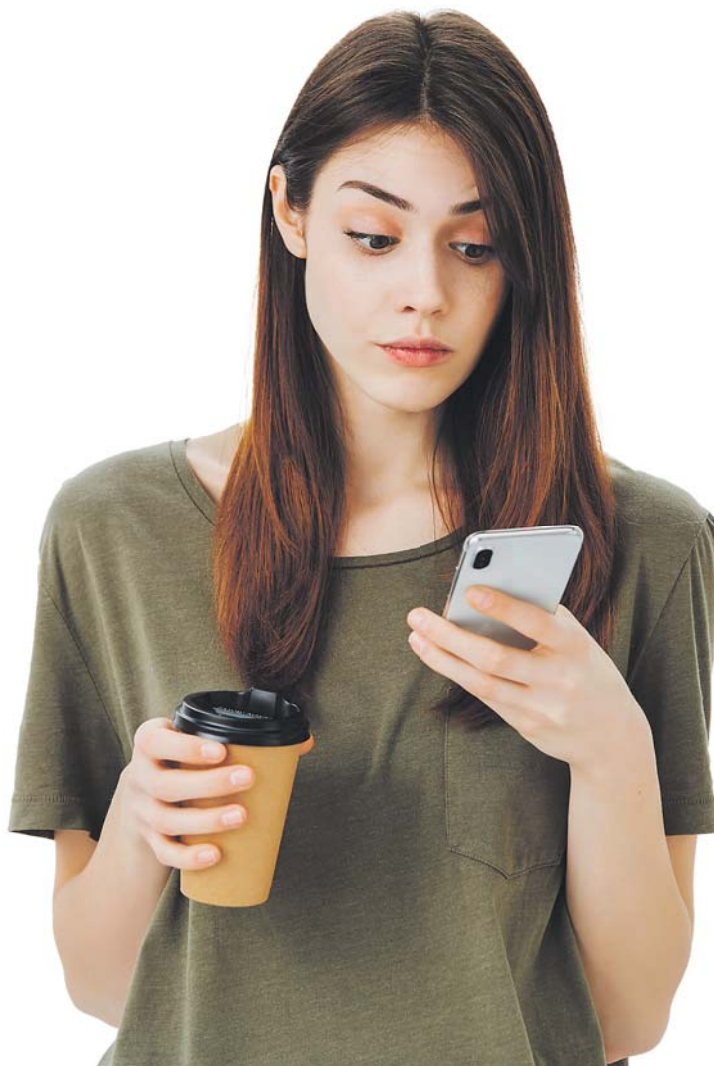
INTERNETOVÉ BANKOVNICTVÍ v mobilu může při nepromyšlených manipulacích přinést potíže.

Podivné e-shopy, které lákají na nízké ceny a pak zaplacené zboží nedodají nebo zneužijí platební údaje, jsou poněkud na ústupu, ale stále na ně můžete narazit. Proto je důležité být při nakupování na internetu ostražitý a vyhledávat recenze a zkušenosti ostatních zákazníků s daným e-shopem. Navíc je dobré si ověřit, zda internetový obchod splňuje všechny zákonné požadavky a jestli disponuje platnými kontaktními údaji, jako jsou adresa, telefonní číslo a e-mail. Při placení za zboží se doporučuje využívat bezpečných platebních metod, jako jsou například platební brány nebo platby přes PayPal. Dále je vhodné se vyvarovat nákupů na neznámých webových stránkách, které nemají dostatečně profesionální vzhled nebo obsahují mnoho gramatických chyb. V případě, že jste již obětí podvodného e-shopu, je důležité okamžitě kontaktovat svou banku a nahlásit možné zneužití platebních údajů. Dále je vhodné informovat o svých zkušenostech ostatní zákazníky prostřednictvím recenzí na internetu a podat stížnost na příslušné orgány, jako je například Česká obchodní inspekce. „Příkladem situace, kdy se stává kupující obětí podvodu, může být na první pohled lákavá nabídka výrazně levného zboží, kdy posíláte