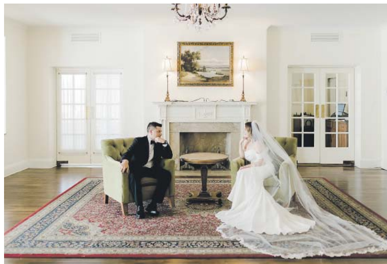
MÁLOKTERÝ mladý manželský pár může o sobě říci, že se hned po svatbě stěhuje do svého...

„V předchozích třinácti letech se obecní bytový fond snížil o víc než polovinu. Tento trend se ale už zastavil a postupně se daří bytový fond znovu navyšovat. Ať už výstavbou nových domů, tak koupí již postavených bytových domů, které by byly vhodné jako nájemní byty pro Pražany. Finišujeme s rekonstrukcí bývalého hotelu Opatov, kde přibude 272 bytových jednotek, rekonstruujeme Bažův dům v Moskevské,