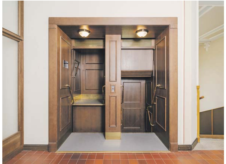
PÁTERNOSTER , kterým se pyšní budova Nové radnice, je úplně prvním výtahem tohoto typu v Česku a datuje se do roku 1911.

Staré Město – Magistrát hl. m. Prahy spustil od 1. června novou komentovanou trasu nazvanou Nová radnice – páternoster tour. Placená vycházka s průvodcem zaveze návštěvníky starší 18 let i do interiérů Nové radnice. Prohlídkový okruh pro širokou veřejnost je zpřístupněn o víkendech, svátcích a ve vybraných podvečerních časech všedních dnů. V rámci prohlídkového okruhu, který má několik zastavení, se návštěvníci svezou nejen oblíbeným páternosterem, ale prohlédnou si také vybrané interiéry historické budovy Nové radnice, které nejsou veřejnosti běžně přístupné. K vidění bude například reprezentativní schodiště z roku 1911 obložené mimo jiné mramorem nebo Velká jednací síň Zastupitelstva hl. m. Prahy. (red)