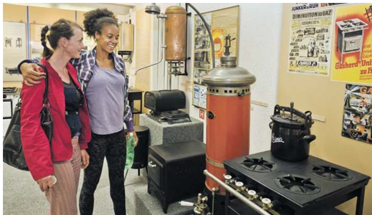
V PLYNÁRENSKÉM muzeu se na vlastní oči přesvědčíte, jak se dříve pomoci plynu nejen vařilo, ale i žehliho či se upravovaly vlasy.

klad Městská knihovna, Národní zemědělské muzeum, Meet Factory, muzeum Davida Černého, Plynárenské muzeum, Kunsthalle, Galerie AMU, Atrium Žižkov, Platforma 15, Galerie Chodovská tvrz, Galerie Kurzor nebo Muzeum Karla Zemana. Program bude probíhat 15. června mezi 19.00 až 24.00 hodinou. Více informací na http://prazskamuzejninoc.cz . (red)